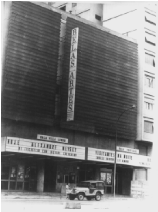
cine belas artes (1971)

Em 1929 eu morava na rua Domingos de Moraes: era uma rua tão tranqüila que a gente podia jogar futebol à noite na calçada. Eu tinha um cachorro fox, muito sabido, que entrava no cinema junto comigo. Ficava lá sentado