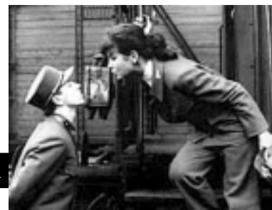
Jirí Menzel: Trens Estreitamente Vigiaados

totalmente voltada para o público amante do chamado film d'art . A iniciativa inovadora do Coral serviu de modelo para a instalação de outras salas de arte pelo resto do país, nos anos que se seguiram.