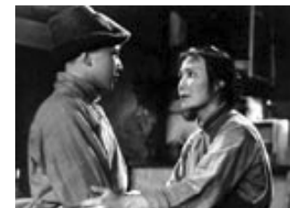
sang hu sacrificio do ano novo