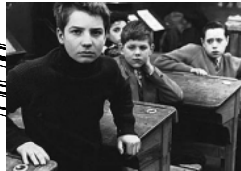
françois truffaut os incompreendidos