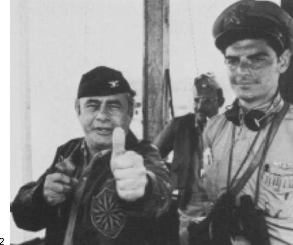
mike nichols ardil 22

dia 11, terça-feira 16h50 UM DIA UM GATO 19h CIDADÃO KANE dia 12, quarta-feira 16h10 O ÚLTIMO IMPERADOR 20h TRENS ESTREITAMENTE VIGIADOS dia 13, quinta-feira 16h O DESTINO BATE À SUA PORTA 19h A DOCE VIDA dia 14, sexta-feira 16h Z 19h A DOCE VIDA