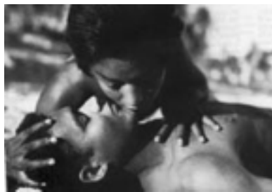
glauber rocha barravento

foi uma das raras vezes em que ele comentou publicamente a obra do grande cineasta. Ainda nesta fase, Dante programou o filme Sacrifício do ano novo , de Sang Hu, o primeiro filme chinês distribuído no Brasil.