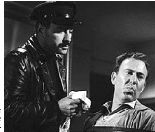
norman jewison os russos estão chegando

Está no programa da Gaumont [empresa que comprou o Belas Artes em 1983] criar os conglomerados de salas; de cada