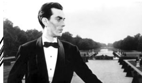
alain resnais o ano passado em marienbad

Eu acredito que a programação do tipo “Cinema de Arte” influenciou todos estes Centros e pontos de exibição alternativos ou culturais e repercutiu inclusive no circuito comercial. Algumas fitas que antigamente