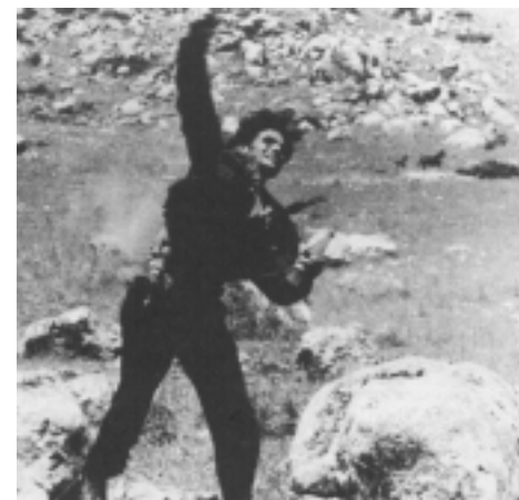
francesco rosi o bandido giuliano

passar A doce vida [o contrato para a exibição do filme seria de dez semanas no Cine Astor e de apenas duas semanas no Coral]. Você aceita, Dante?" "Não podendo passar mais, passo duas semanas". A conclusão foi que o Astor passou a fita uma semana e meia e eu passei vinte e quatro semanas.