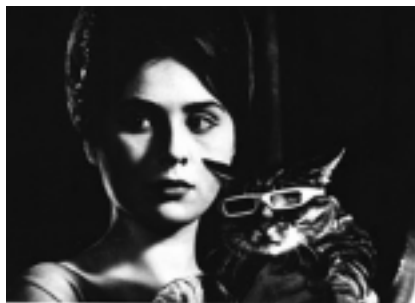
vojtech jasný um dia, um gato

O Cinearte durou nove anos; com o incêndio do Cine Bristol na avenida Paulista, a Companhia Sul do Francisco Lucas, à qual o cinema estava ligado, precisou usar o Cinearte para programar os filmes do Bristol. Não me interessei por ficar sujeito a uma programação tipicamente comercial e assim não havia mais motivos para permanecer; me desliguei em bons termos, sem desgastes, com o Lucas.