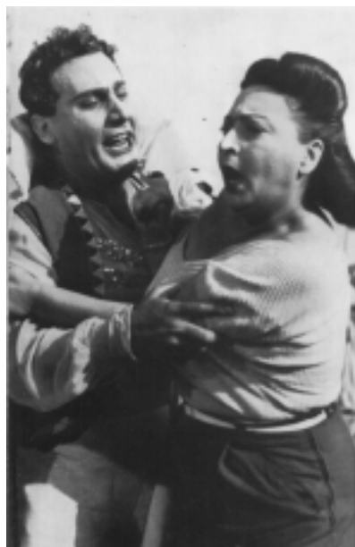
federico fellini o sheik branco

O [distribuidor e exibidor] Sorrentino me procurou para dizer: "Você tem de