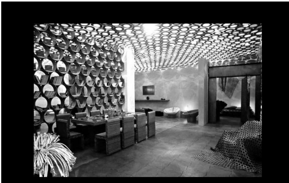
“Casa do Leitor”, ambiente produzido em papel e papelão. Mostra Brincadeiras de Papel, Sesc Belenzinho, São Paulo - Foto: Eduardo Barcelos