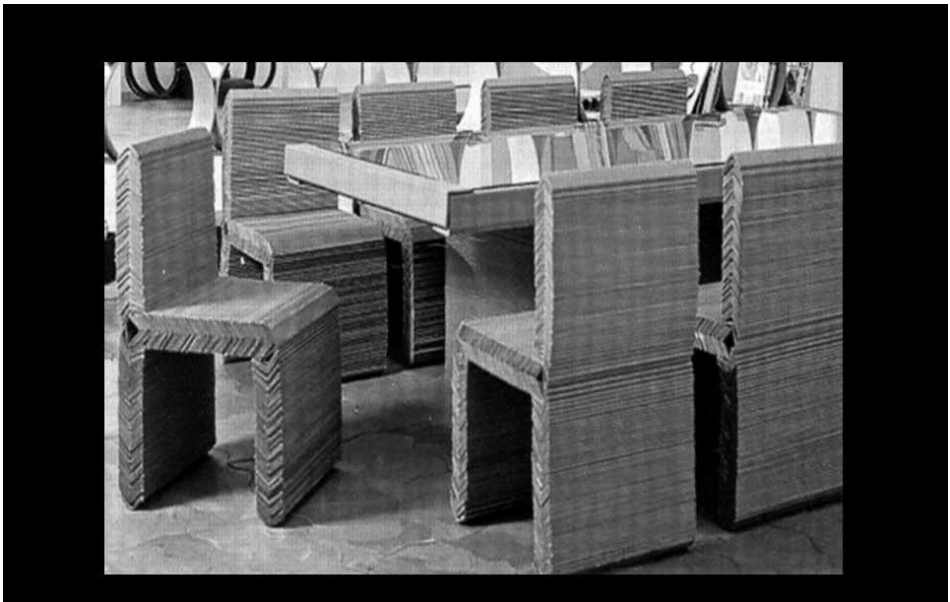
Cadeiras e mesa feitas de cantoneiras de papelão