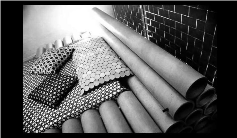
Detalhe "Quarto de Adulto", Sesc Belenzinho, São Paulo