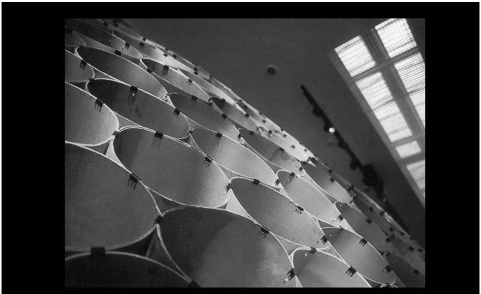
Detalhe da Oca, Sesc Santo André, São Paulo - Foto: Eduardo Barcelos