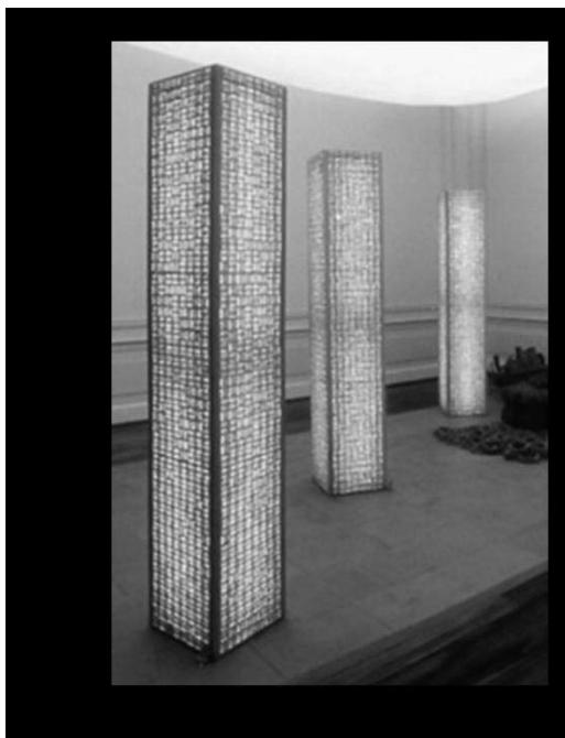
Luminária Origami, Museu da Casa Brasileira, São Paulo