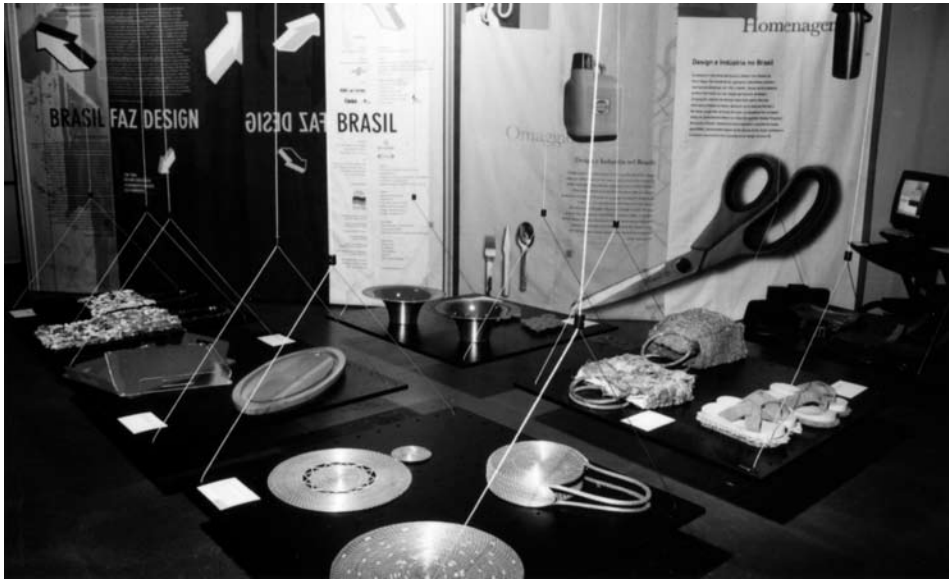
“Brasil Faz Design”, MuBE, São Paulo, 2002