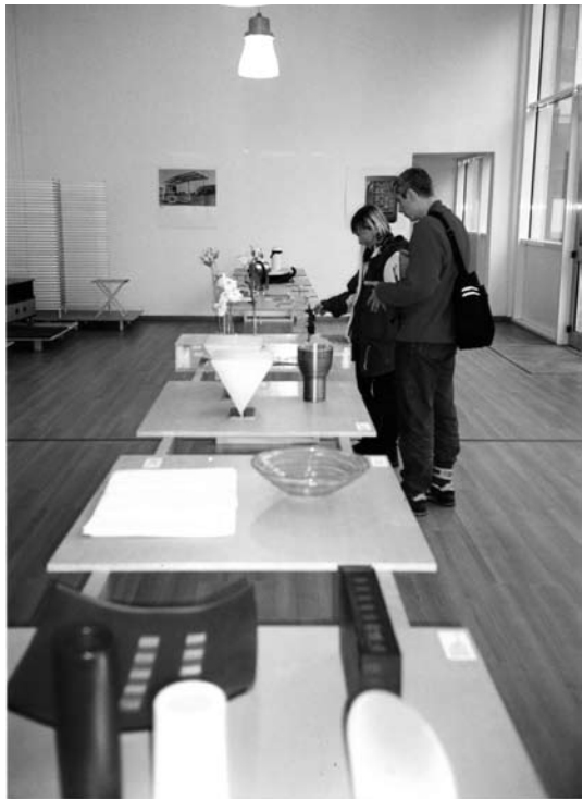
“Brasil Faz Design, Scuola Umanitaria”, Milão, Itália, 2000