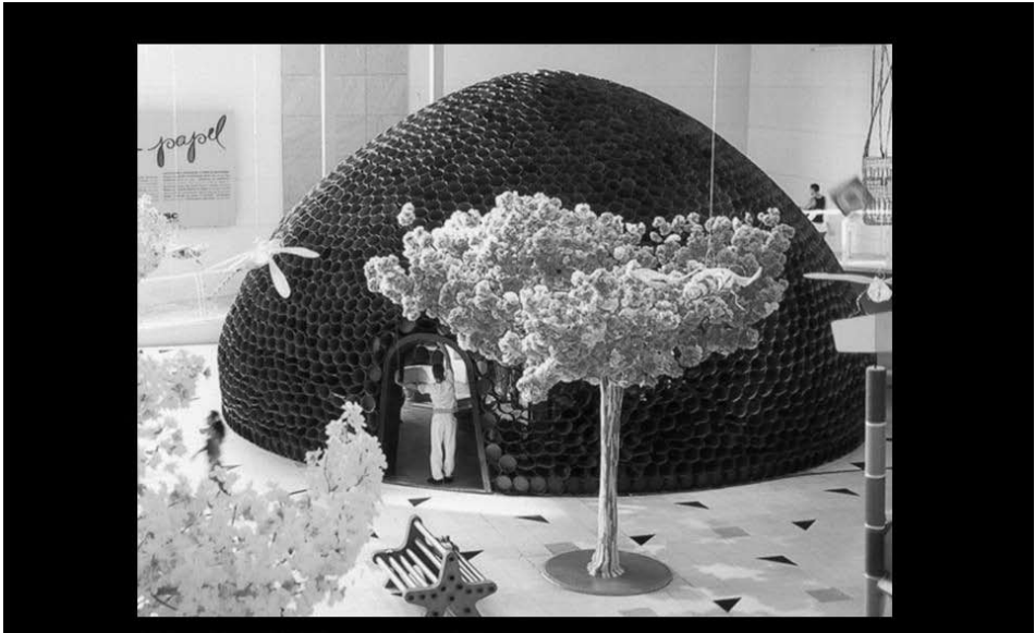
“Oca”, Sesc Santo André, São Paulo