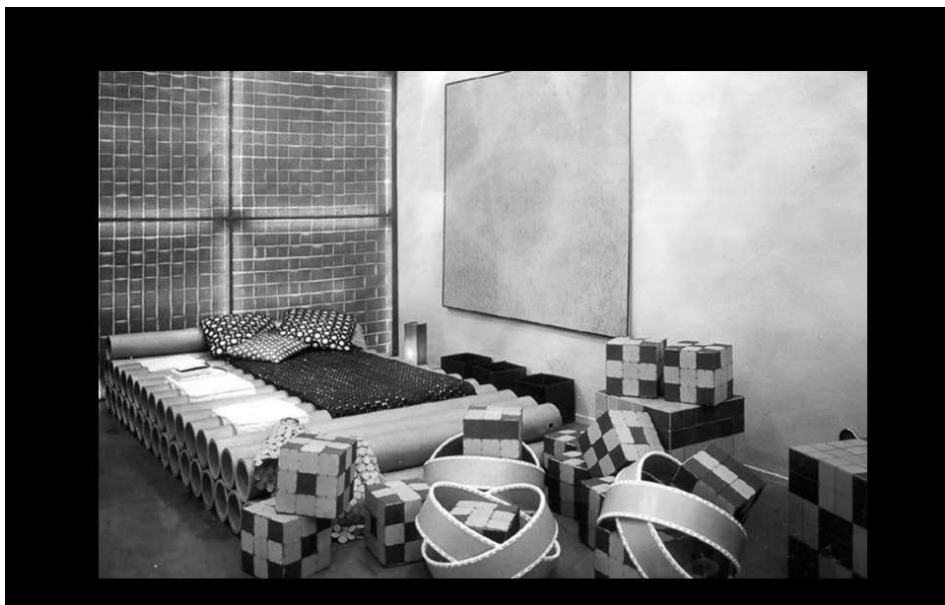
“Quarto de Criança”, Sesc Belenzinho, São Paulo