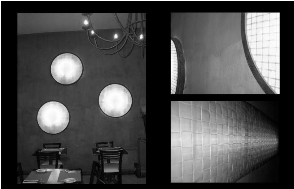
Luminárias de tecido de papel feitas para o Restaurante Coq. Rua Tupi, São Paulo