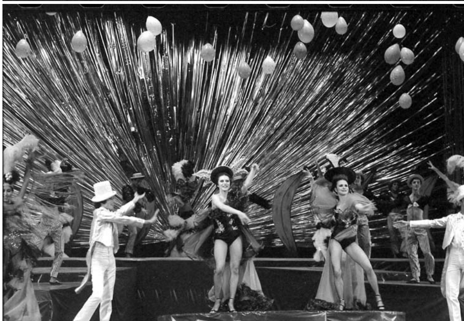
Aquarela do Brasil, 1979