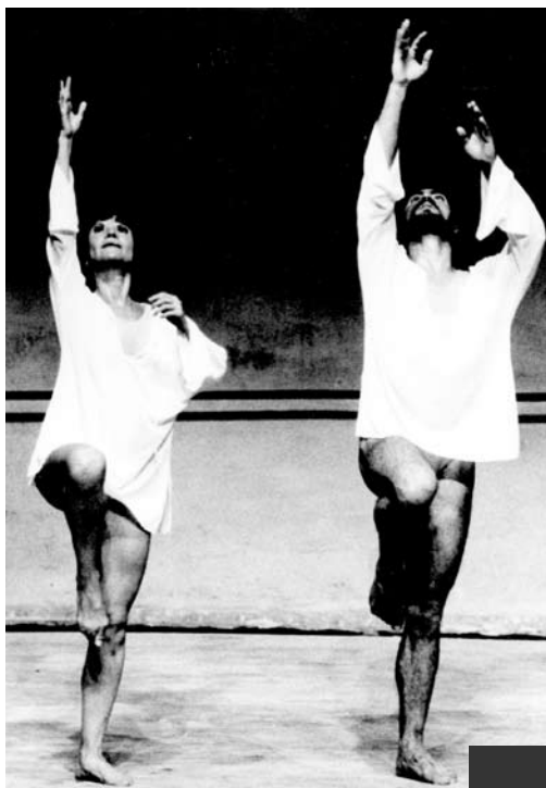
Um Sopro de Vida, 1979