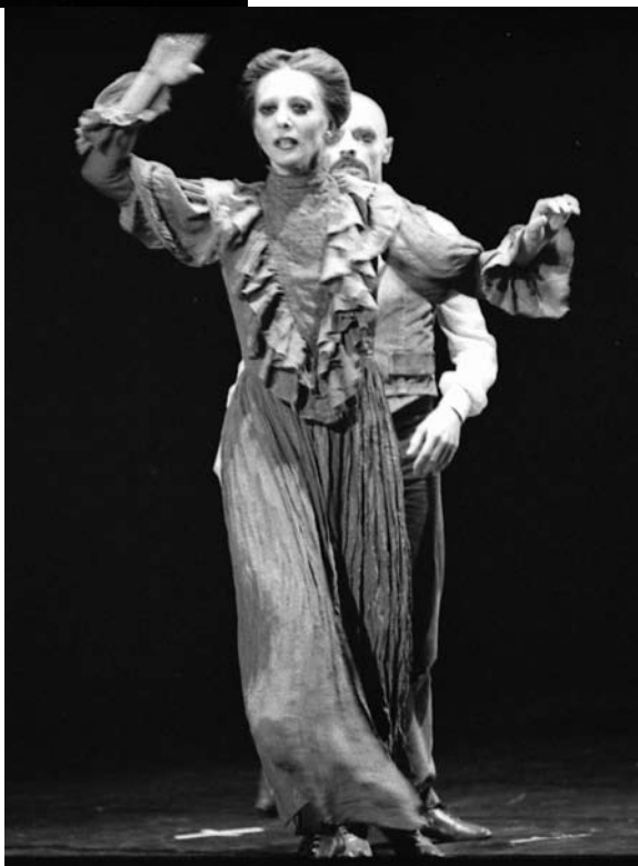
Cenas de Família, 1978 Corpo de Baile Municipal Coreografia Oscar Araiz Interpretação Iracity Cardoso